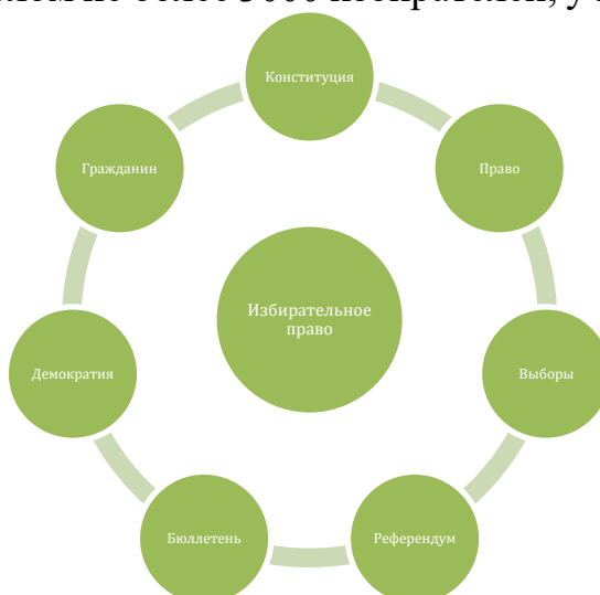
Рис.1 «Круг терминов»

Участок для голосования – территория, имеющая свои границы, образуемая в период выборов и референдумов, для проведения голосования и подсчёта голосов, с числом не более 3000 избирателей, участников референдума.