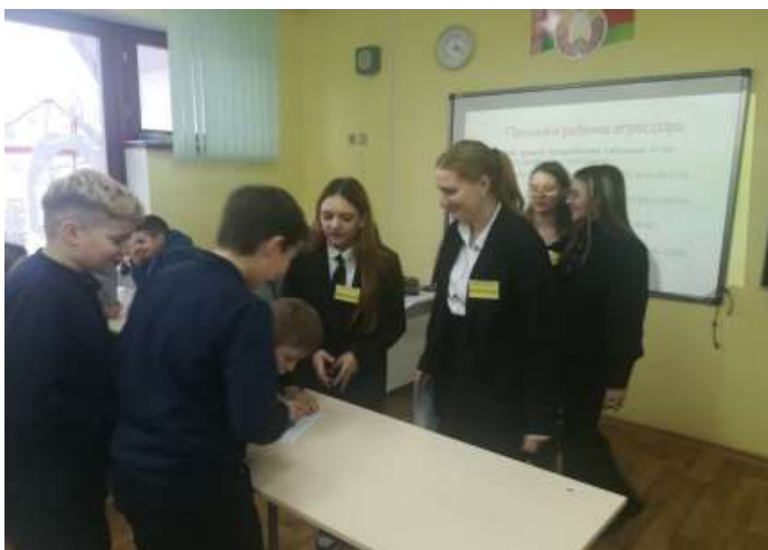
Интерактивные занятия с учащимися 5 класса