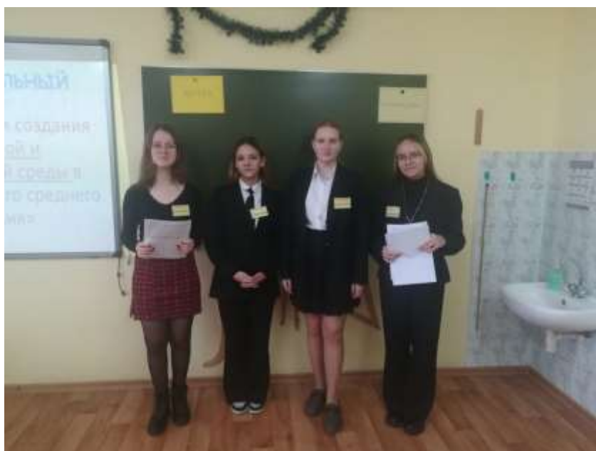
ИНИЦИАТИВНАЯ ГРУППА «ШКОЛА БЕЗ БУЛЛИНГА»