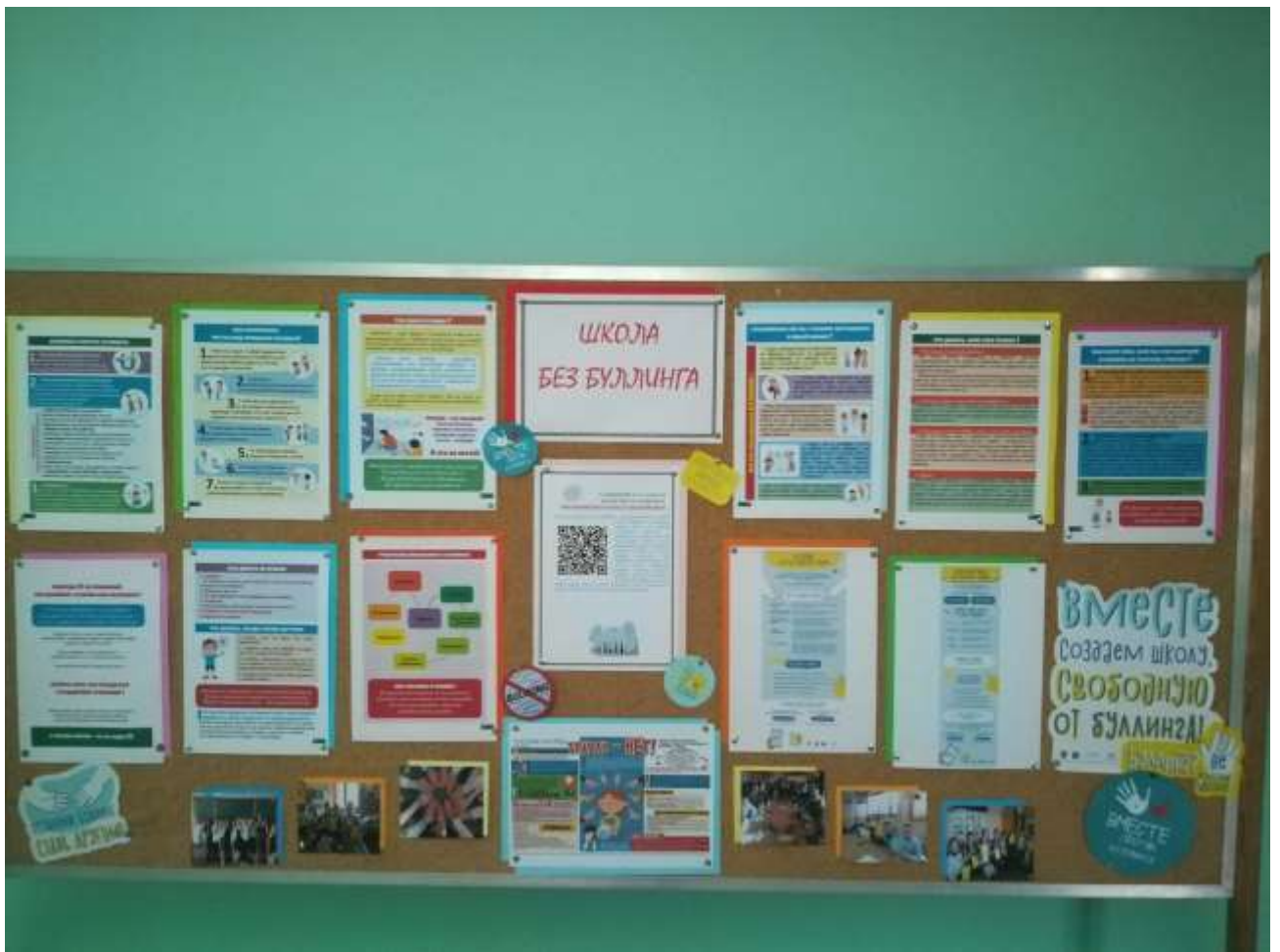
Стенд «Школа без буллинга»